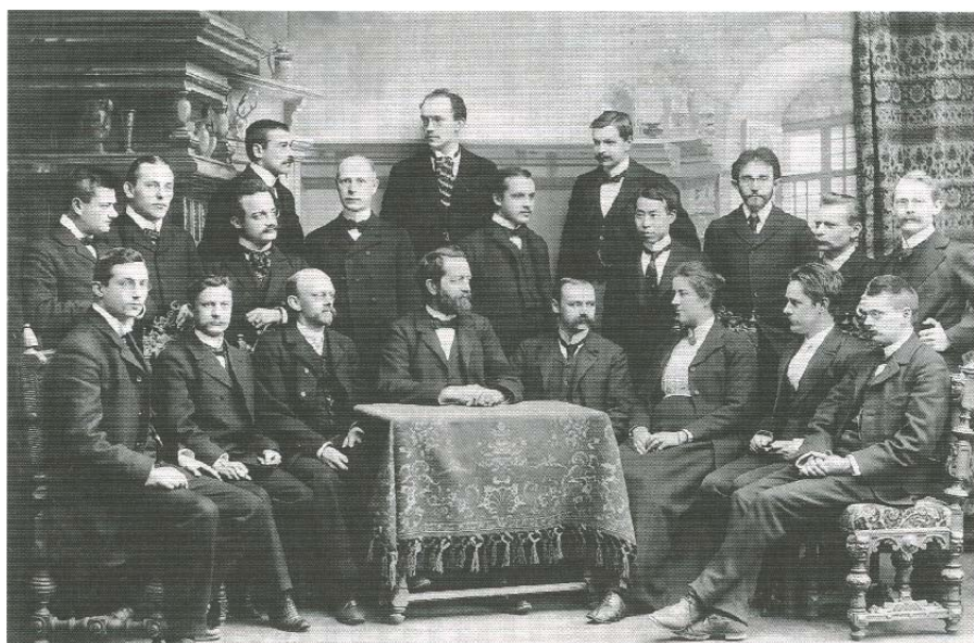
La Sociedad Matemática de Gotinga en 1902. De los sentados, el tercero por la izquierda es D. Hilbert; a la derecha tiene a F. Klein. El primero por la derecha es E. Zermelo.

parte, definiríamos \mathcal{B} como la unión de la familia (\mathcal{B}_\xi : \xi \in \omega_1) , definida por recursión transfinita de modo que \mathcal{B}_0 es la clase de los conjuntos abiertos, y, para cada ordinal numerable \xi > 0 , \mathcal{B}_\xi es la clase de los complementos y de las uniones numerables de conjuntos en \bigcup_{\eta < \xi} \mathcal{B}_\eta . En general, en matemática no conjuntista se tiende a evitar el uso de ordinales y la recursión transfinita. Una manifestación notable de este hecho lo hallamos en el uso generalizado del lema de Zorn, una especie de caja negra que evita las construcciones por recursión 5 ; otra, en la usual limitación a los axiomas de Zermelo de 1908, rehuendo el uso del axioma de sustitución, sin el cual no hay recursión transfinita 6 .