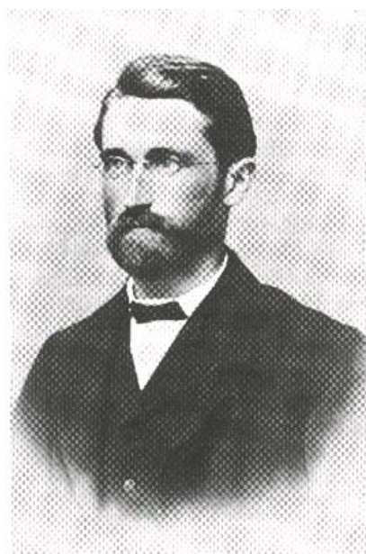
Richard Dedekind (1831–1916)

Las primeras aplicaciones indiscutibles de técnicas conjuntistas las efectúa Dedekind en álgebra, con la caracterización abstracta de estructuras, como la de cuerpo o la de anillo, a la manera actual (consistentes en un conjunto y una o más operaciones que cumplen ciertas condiciones debidamente especificadas), y con la consideración de homomorfis-