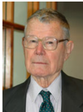
Thomas C. Schelling